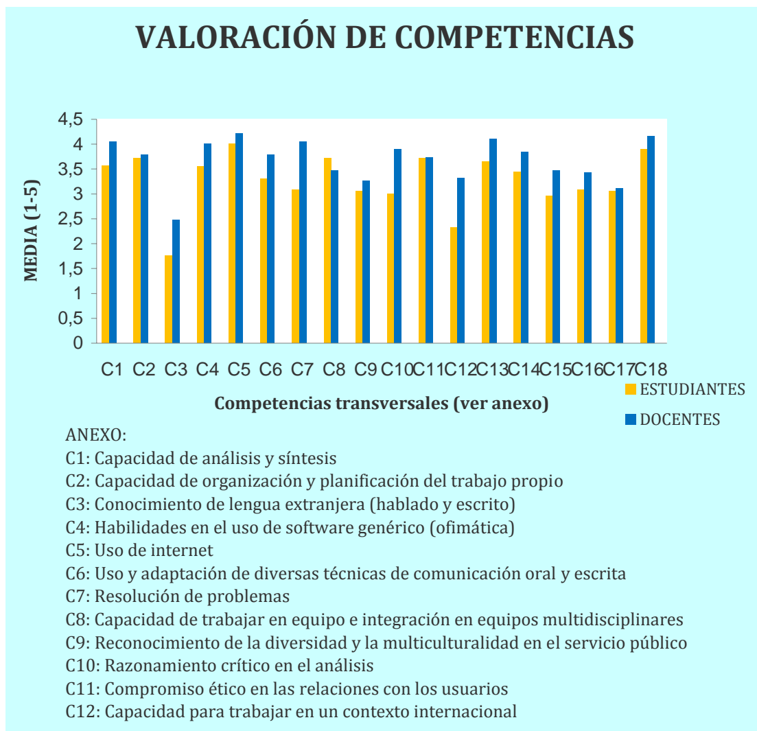
Gráfico 3.3.a. Valoración de competencias

En la tabla comparativa 3.3.1. y su representación gráfica (gráfico 3.3.a) cabe destacar dos aspectos: 1) Las valoraciones medias de los Docentes son superiores a las valoraciones medias que los Estudiantes hacen de las competencias. En este caso la media general para los Docentes es de 3,675, mientras que la media general de los Estudiantes es de 3,272; 2) Las diferencias en su porcentaje de votos son similares a las de los valores medios.